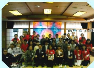
本日はありがとうございました 2024年11月17日(日)