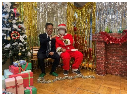
12月18日 幸児童館 クリくるパーティ