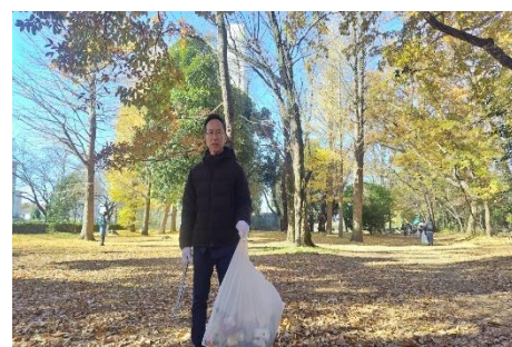
12月7日 野火止用水保全対策協議会 野火止用水クリーンデー