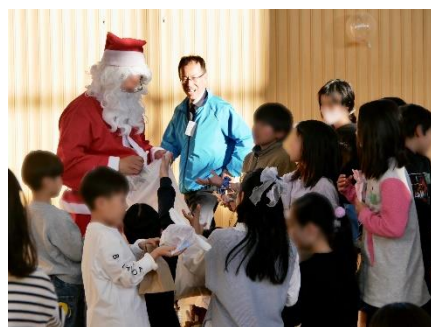
12月15日 柏町子ども会クリスマス会