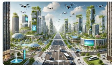
こちらが、30年後の立川の将来図を描いたイメージです。自然と技術が調和した持続可能な都市の姿を表現しています。

＜答弁＞ 課題を整理し、AIの活用について、事業者からの実証実験として募集する検討をしていく。（市長公室長） ※右図は、AIを使用して、30年後の立川の将来図を描いたものです。僅か15秒程で作成しています。