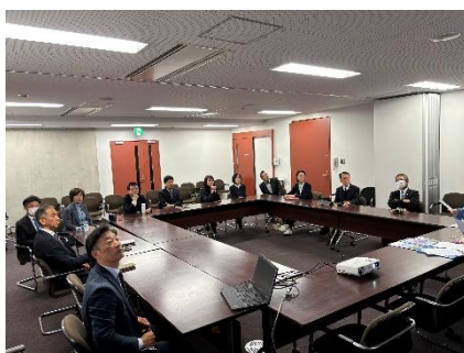
12月6日 立川文化議連視察研修報告会