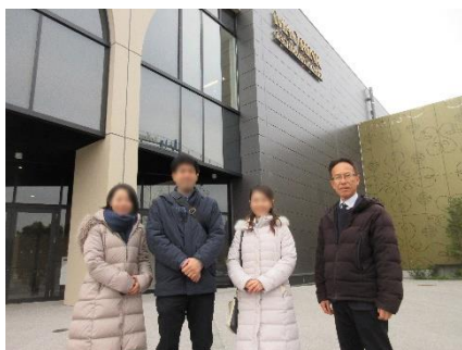
12月13日 立川市スポーツ議連マオリンク 内覧会